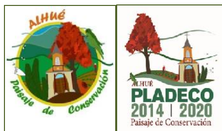
Logos oficiales del Paisaje de Conservación y del Pladeco de Alhué

conservación y de desarrollo, sino que también en un instrumento de gestión y de planificación territorial al establecer líneas de acción en el desarrollo, conservación y la gestión local. Es una muestra clara del compromiso e iniciativa local por el desarrollo sustentable del territorio, con el objetivo de proteger el patrimonio natural y cultural de la comuna.